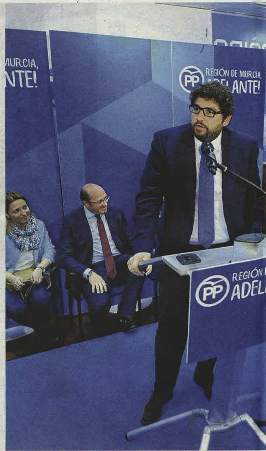
Fernando López Miras, ayer, se dirige a la Junta Directiva del PP.

En lo que no habrá variación es en las grandes líneas de la gestión política desarrolladas por el Ejecutivo autónomo hasta ahora y marcadas por su anterior jefe para los próximos meses. Para que eso ocurra, el propio Pedro Antonio Sánchez, que seguirá como diputado regional y presidente del PP mur-