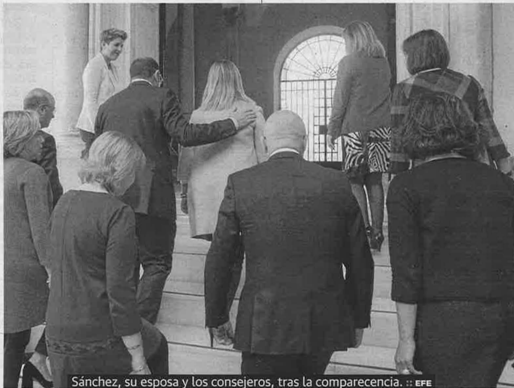
Sánchez, su esposa y los consejeros, tras la comparecencia.

«Para mí es una obsesión conseguir el progreso y la prosperidad de las gentes de la Región»